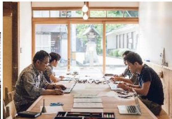
ソフト開発の様子

最初は、ITの仕事にプランクがあったので不安もあり、ITはとにかく進歩が早いので戸惑いも感じていました。でも、ITとかIoTとか最先端の仕事に携わることに、刺激ややりがいを感じています。今は、施設園芸で環境をコントロールするため、センサーで自動に制御できるプログラムを開発中です。自分の感覚と向き合って、ひとつひとつ積み重ねながら、安定して使えるように早くサービスインさせたいです。お客さんの「あったらいいな」を実現する希望の持てる職業ですね。