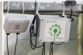
圃場モニタリングシステム